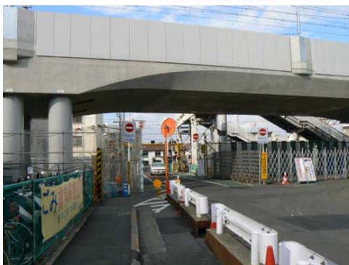
本町踏切（左側に雨水発電、 貯留施設を設置予定）